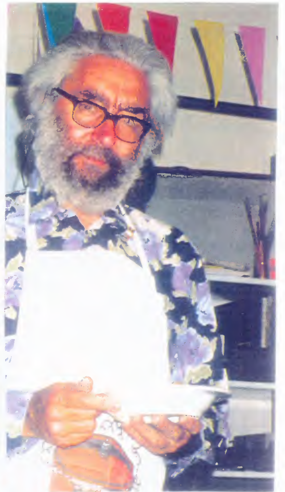
parata di tegami (notare la divista e - per chi ha gli occhi buoni - il distintivo!)

PRESENTAT ARM! APPLAUSI! APPLAUSI AI GLORIOSI TEGAMI!